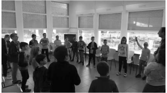
Ateliers avec les CE2 et CM1 de l'école primaire de la Cité de Bellaing autour d'un travail de cartes postales sonores à partir des poèmes étudiés en classe.