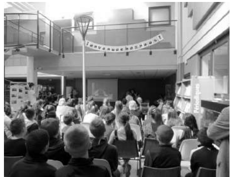
Ateliers avec la classe Ulis du Collège Madame-d'Epinaay d'Aulnoy-lez-Valenciennes sur la représentation d'un ciné-concert autour de 4 films muets. La bande son est créée en direct à partir des enregistrements réalisés à Art Zoyd Studios par les élèves.