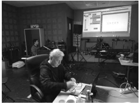
Travail à Art Zoyd Studios avec les étudiants de la FLLASH - Faculté Polytechnique de Valenciennes et Kasper T. Toeplitz (compositeur et musicien) sur l'initiation à la création musicale contemporaine.