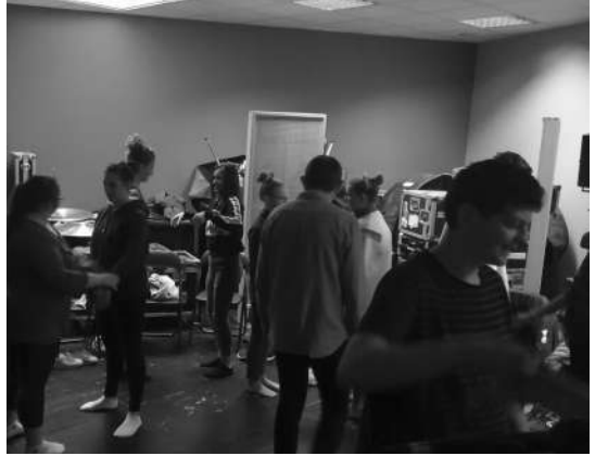
Ateliers avec les 3 e du Collège Saint Jean Baptiste de la Salle de Valenciennes à propos d'un travail de design sonore sur les sonneries rythmant la vie de l'établissement.