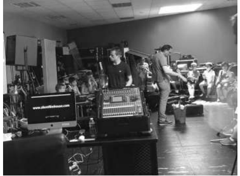
Travail à Art Zoyd Studios avec les élèves du Conservatoire de Valenciennes