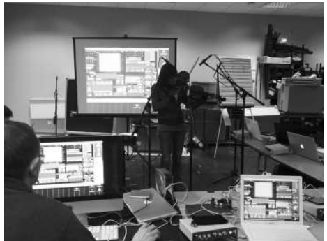
Travail à Art Zoyd Studios lors des sessions SOUND'UP, classe de composition électro-acoustique et multimédia.