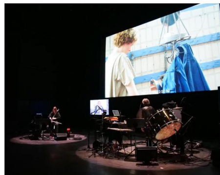
Le ciné-concert « Mémoires d'éléphant », qui se produira à Valenciennes et à Wallers, mêle musique enregistrée et jouée en live.

Extrait du journal La Voix du Nord - Mercredi 18 mars Page 14/15