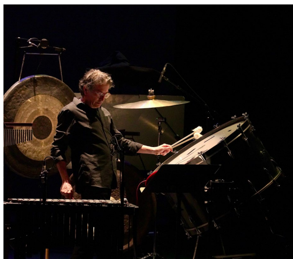
Didier Casamitjana © Art Zoyd Studios