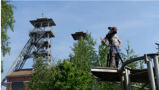
Victor Villafagne - vidéaste ©Art Zoyd Studios