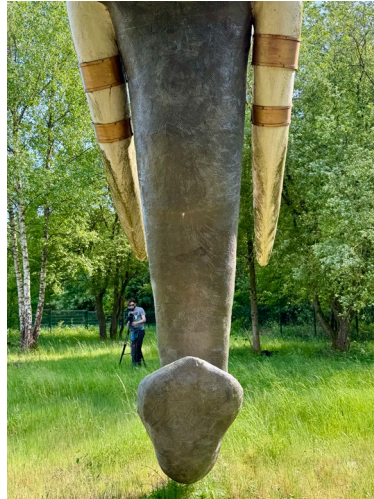
Victor Villafagne - vidéaste ©Art Zoyd Studios