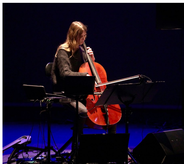
Pénélope Michel © Art Zoyd Studios