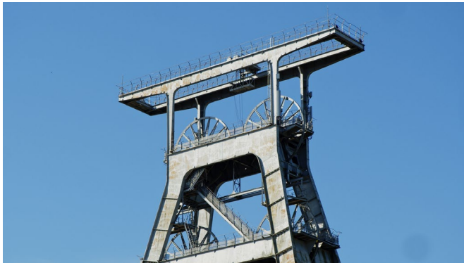
détail de chevalement