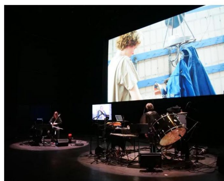
Le ciné-concert « Mémoires d'éléphant », qui se produira à Valenciennes et à Wallers, mêle musique enregistrée et jouée en live.

Extrait du journal La Voix du Nord - Mercredi 18 mars Page 14/15